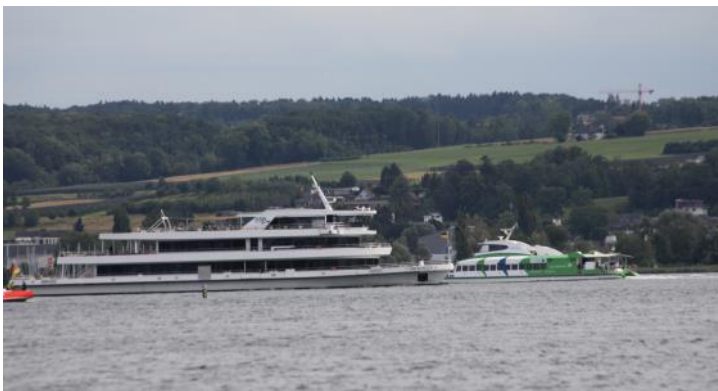
Wohin geht es?